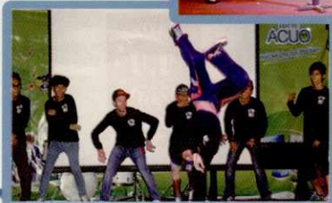
CLB HIP HOP