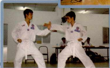
CLB VÔ THUẬT