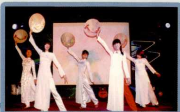
CLB NỮ SINH