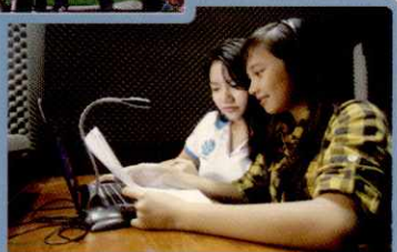
CLB PHÁT THANH