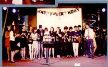
CLB ANH VĂN